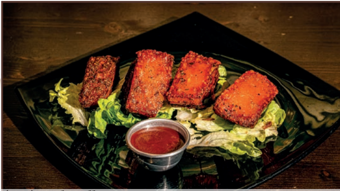
(242) Pork Belly Pancetta di maiale cotta a bassa temperatura, glassata in bbq , con contorno a scelta 10.00