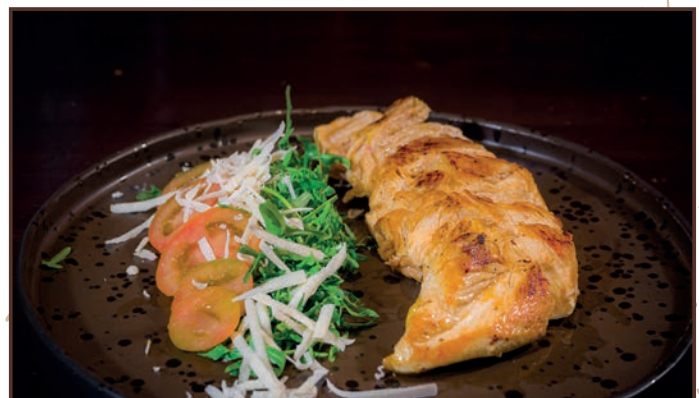
(227) Tagliata di pollo Tagliata di pollo da gr 300, rucola, pomodori , scaglie di grana 12.00