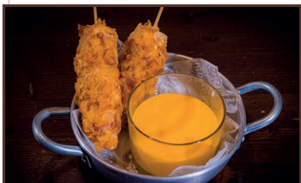
(07) Corn Dogs

Pz 2 Bockwurst con panatura ai cereali e salsa cheddar 4.50