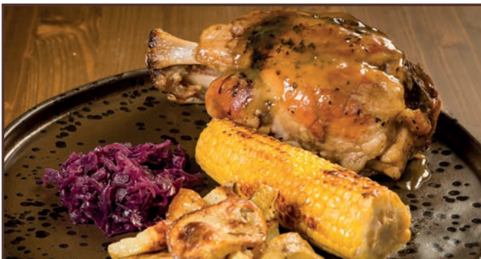
(222) Highlander Stinco di maiale da 800 gr cotto a bassa temperatura alla birra Patate al forno, crauti rossi, pannocchietta arrostita. 19.00