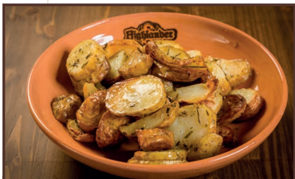
(09) Patate al Forno

Patate lavorate dal fresco aromatizzate alle erbe, con aggiunta di Olio EVO 4.00