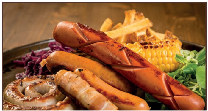
(221) Sassonia Mix di wurstel tedeschi Crauti rossi Patate fritte Pannocchia alla piastra . 14.00