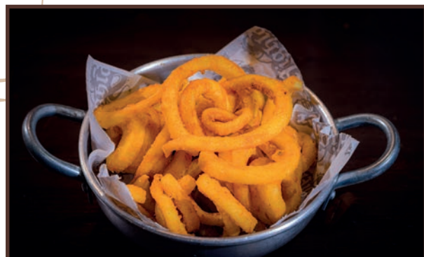
(13) Patate twist

Pz 4 Nuggets di parmigiana di melanzane panata e frita 4.50