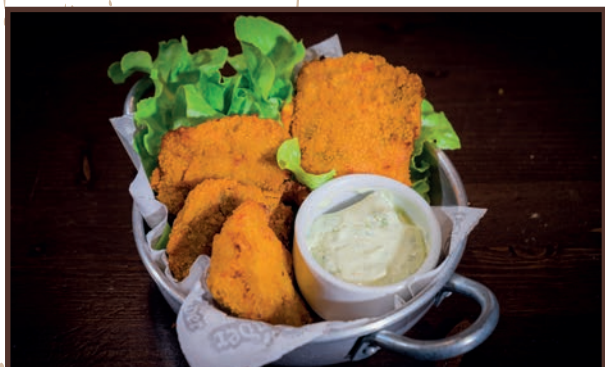
(12) Nuggets di parmigiana

Pz 4 Nuggets di parmigiana di melanzane panata e frita 4.50