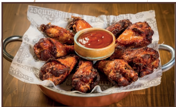
(03) Alette *

Pz 8 Alette di pollo fritte + Salsa bbq Jack 6.50