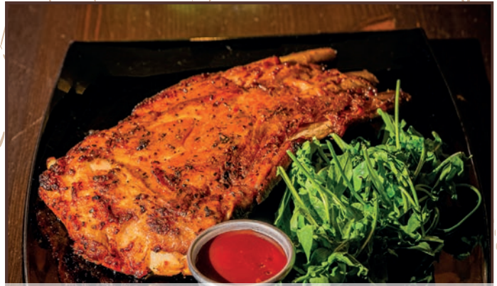
(224) Irish Ribs Ribs di maiale da 800 gr in salsa Bbq con contorno a scelta 18.00