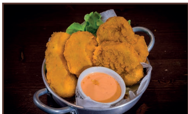
(08) Straccetti di Pollo

Pz 2 Bockwurst con panatura ai cereali e salsa cheddar 4.50