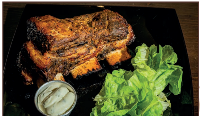
(244) Short beef ribs Costine di manzo cotte a bassa temperatura con contorno a scelta 25.00