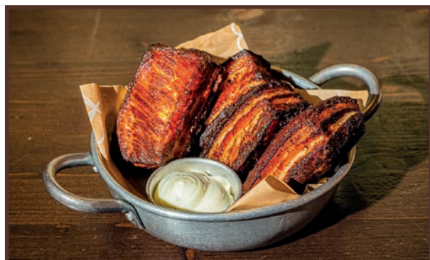
(06) County Ribs

Patate lavorate dal fresco aromatizzate alle erbe, con aggiunta di Olio EVO 4.00