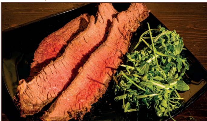
(243) Brisket Punta di petto cotta a bassa temperatura con contorno a scelta 17.00